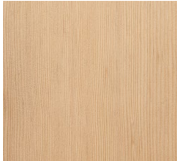
Hemlock Canadese (Liscio) Interno, esterno Canadian Hemlock (Smooth) Inside, outside