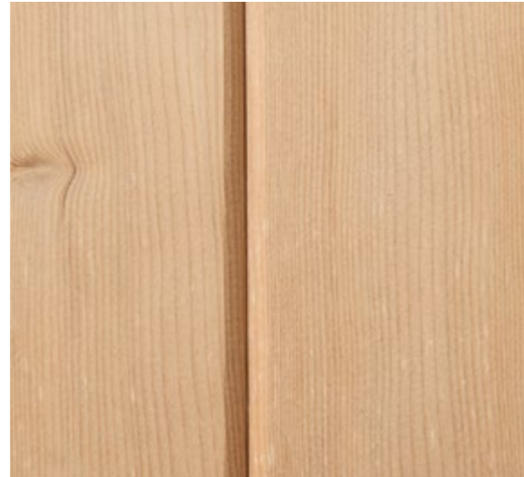
Hemlock Canadese (Doghe) Arredi Canadian Hemlock (Slats) Fittings