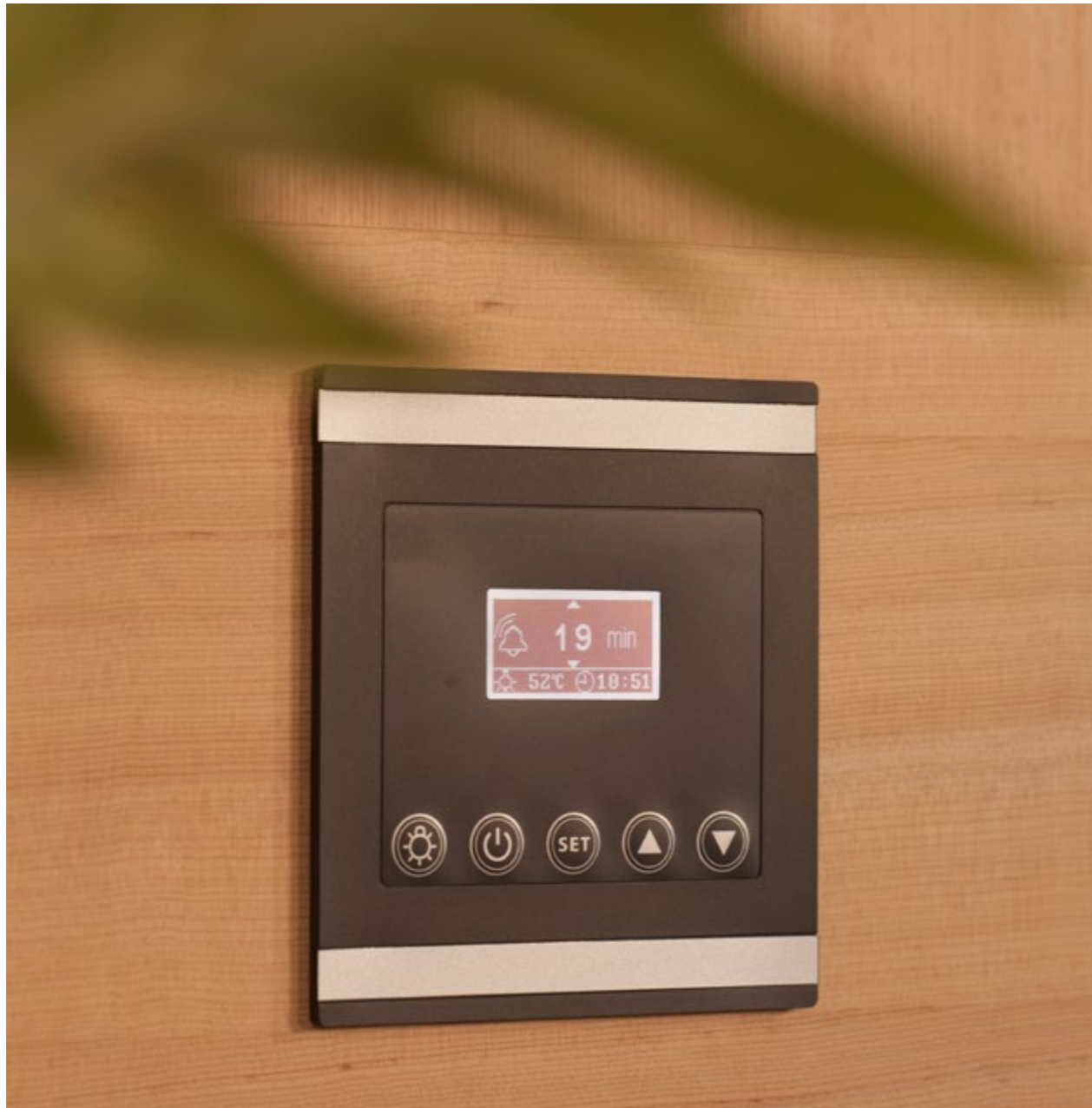
Finish: Canadian hemlock.