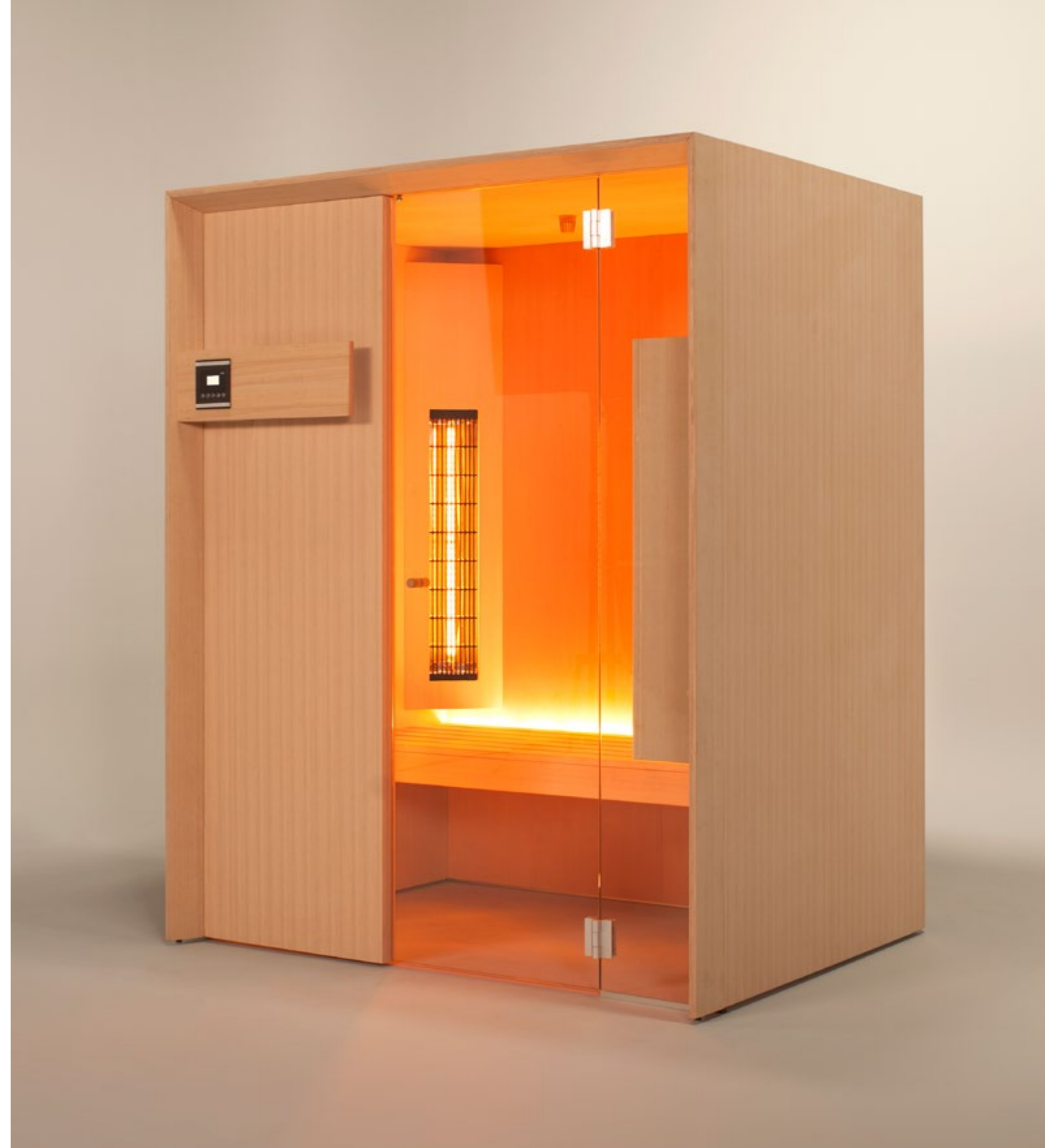
Idea IR / sauna /