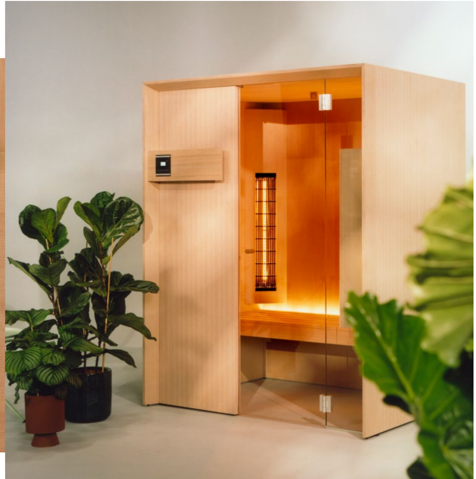
Idea IR / sauna /