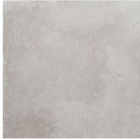
Light 60x60/24"x24" R LQ31 30x60/12"x24" R NF23