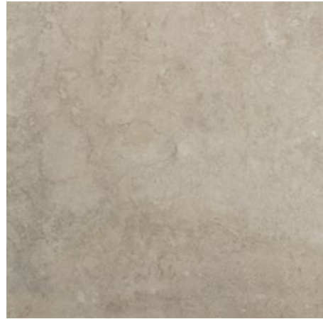
Trend 60x60/24"x24" R LQ33 30x60/12"x24" R NF26