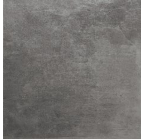
Grey 60x60/24"x24" R LQ32 30x60/12"x24" R NF21