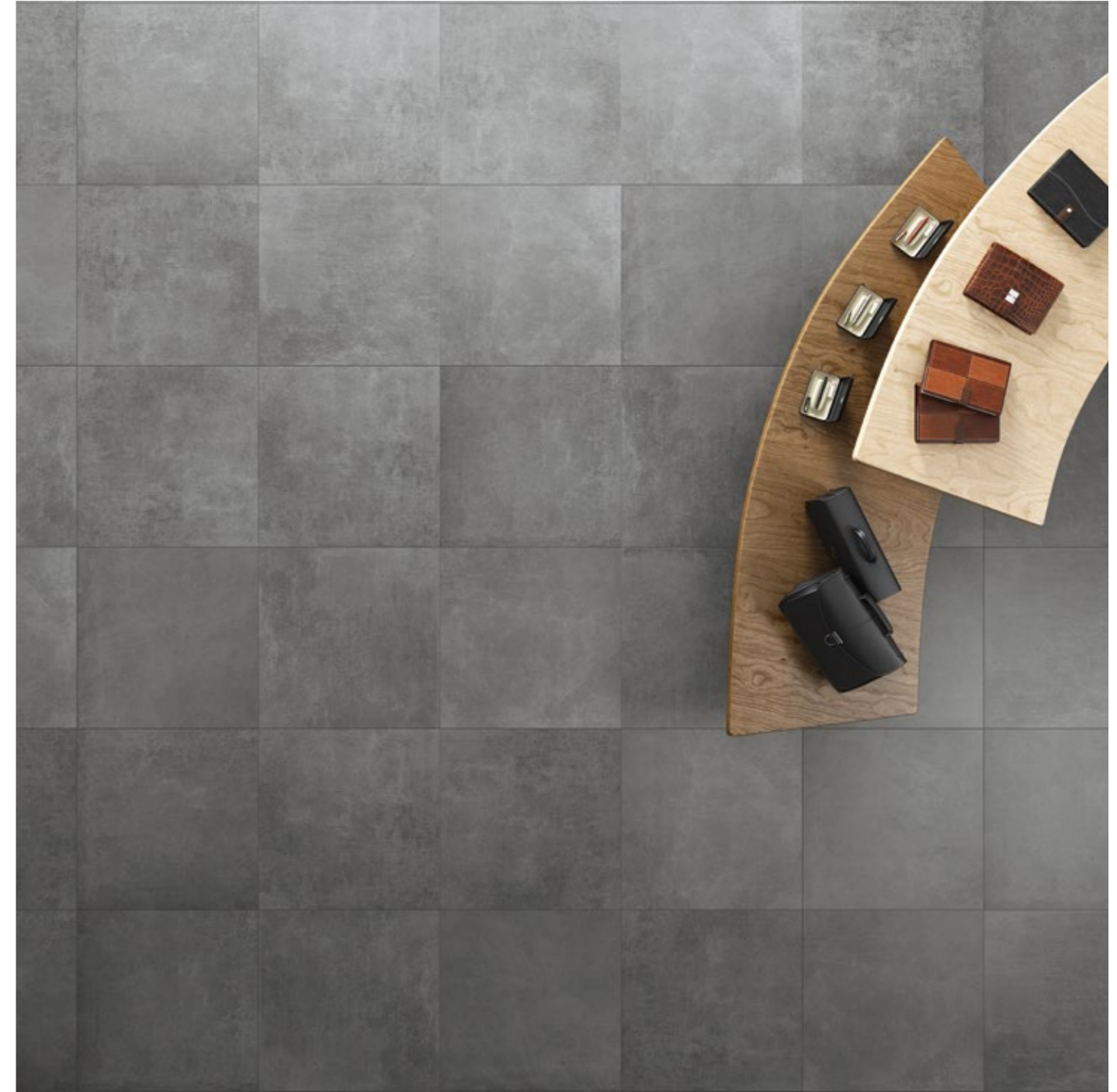
Grey 60x60/24"x24" R