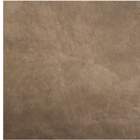
Umber 60x60/24"x24" R LQ34 30x60/12"x24" R NF28