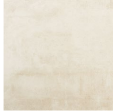
Beige 60x60/24"x24" R LQ30 30x60/12"x24" R NF19