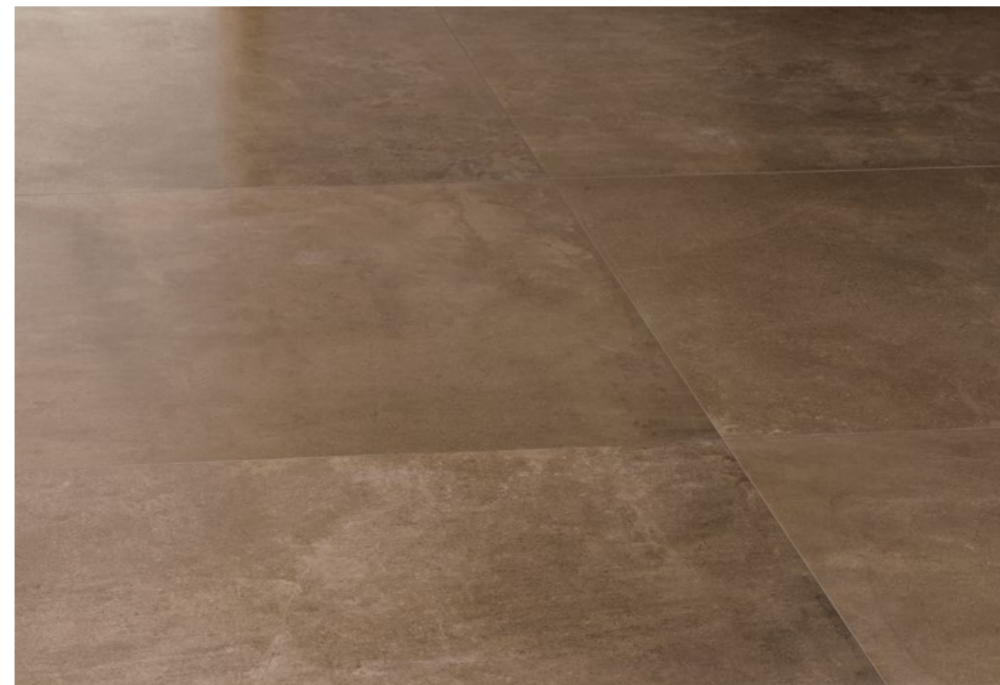
Umber 60x60/24"x24" R

El producto se caracteriza adrede por una leve variación de color y de vetas para recrear la variabilidad y riqueza de los materiales naturales en los que se ha inspirado la colección. Por ello, se aconseja colocar el material eligiéndolo simultáneamente de más de una caja para garantizar la variabilidad y casualidad de la superficie acabada. Dadas las características intrínsecas del producto, las referencias cromáticas que se presentan son puramente indicativas.